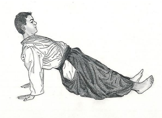
Obr. 3: Konečná poloha cvičení.

Opíráme se o ruce a nohy a zvedáme pánev a současně silou uzavíráme ánus a cítíme koncentraci síly v bodě seika tanden (asi dva prsy pod pupkem). V této pozici se snažte vydržet (Obr. 3) co nejdéle. Pokud vám začne pánev klesat pod úroveň hrudníka, silou se snažte zvednout kyčle směrem nahoru. Ve starém Japonsku prováděli toto cvičení tak, že cvičencům dali pod zadek nůž, anebo ostré hřebíky, ostřím směrem nahoru, aby se zabránilo klesání těla. Takže, aby se opět mohli vrátit do vzpřímené pozice, museli udělat půlkruh jednou rukou a jednou nohou, opírajíc se o zem jenom jednou rukou a jednou nohou. Museli se dostat do pozice "na čtyřech". Jenom tak se vyhnuli tomu, aby byli pořezáni.